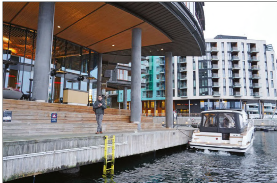
Le Marex 390 amarré dans le quartier d'Aker Brygge devant Hanami, le plus fameux restaurant de sushis d'Oslo.