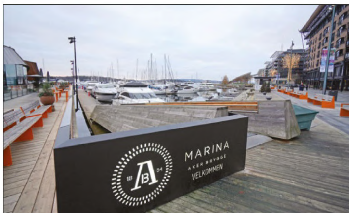
Construite en même temps que le nouveau quartier d'Aker Brygge, la marina compte 180 anneaux dont 50 réservés aux bateaux de passage.