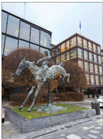
L'art moderne est très présent dans les rues d'Oslo. Ici, une œuvre de Tore Bjørn Skovsvik, sculpteur local très renommé.

La capitale norvégienne est nichée au fond d'un fjord d'une centaine de kilomètres de long, qui débouche sur la mer du Nord.