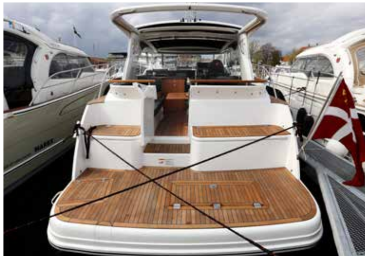
Der er gode kistebænke på badeplatformen. Badestigen er gemt under lugen om bagbord. Der er også plads til en jolle på teakstranden.

Foran det magelige passagersæde er der trin op til den oplukkelige del af vindskærmen.