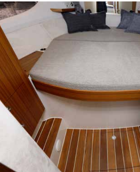
Ejerkahytten under fordækket med stor dobbeltkøje og garderobeskabe, der ses til venstre i billedet. Døren er med hærdet, brudsikkert og splintfri matteret glas.