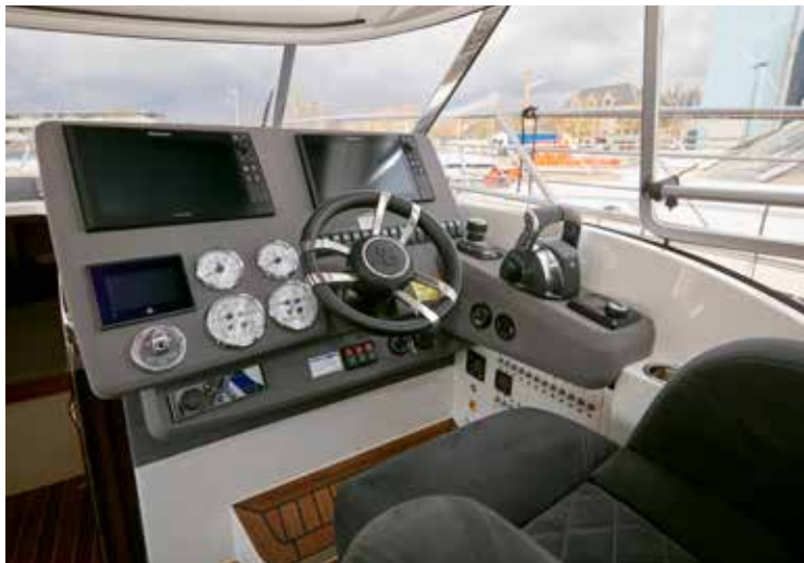
Instrumentbordet rummer både motorinstrumenter og to store Raymarine multiskærme. Joysticket til Mercurys manøvrer system er placeret lige foran gas/gearhåndtaget.

tre liters V6 dieselmotor, der ifølge Mercury udmærker sig med den nyeste commonrail indsprøjtningsteknologi fra Iveco og VW, der er mariniseret af Mercury. Motoren har et højt moment, ca. 10 % lavere brændstofforbrug, færre vibrationer og minimale indbygningsmål. Motorblokken er i aluminium og vejer 358 kg. Det er 20 procent lettere end forgængeren. Endelig er motoren lettere at servicere med alle servicepunkter placeret på motorens front. Vi har ikke testet motoren, men kunne konstatere under vores sejlur, at det er en meget agil motor, der fungerede perfekt.