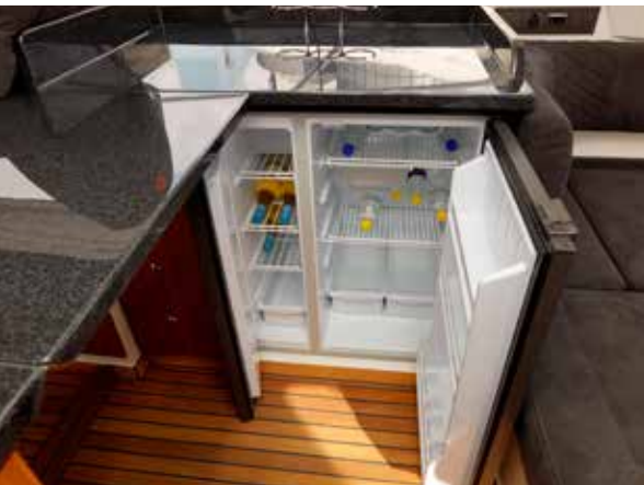
Bådens store køleskab er placeret bag pilotsædet. Klapbordet midtskibs gør pantryet kæmpestort.