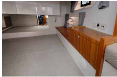
Gæstekahytten er med stor tværskibs dobbeltkøje. Der er ståhøjde indenfor døren.