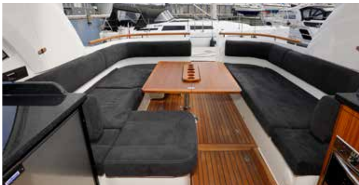
Den store sofagrube agter fungerer som cockpit, når båden er åben og som salon, når cabrioletkalechen er lukket. Der kan sidde op til 10 personer ved bordet, der kan sænkes, så U-sofaen forvandles til en sol seng.

Tiderne er inklusiv den indbyggede forsinkelse fra motorernes gas-kontrol. Når man lærer at udnytte bådens Zipwake trimflaps, vil topfarten og accelerationen sandsynligvis kunne optimeres yderligere. Vores testresultater vidner om effektive sejlede linjer, fordi vi opnåede dem uden brug af flaps. Vi må desuden nævne, at der var en fin balance i båden mens vi accelererede, så vi hele tiden havde et fint udsyn fra pilotsædet.