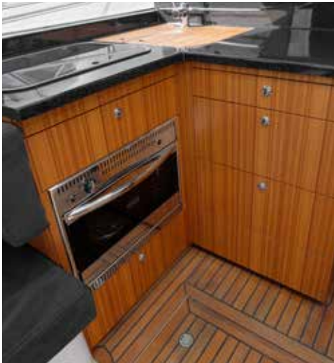
Pantryet om bagbord er L-formet med gasblus, indbygget ovn og skuffer til køkkengrejet. Dobbeltvasken er indstøbt i pantrybordet, og er her dækket af store spækbrætter.