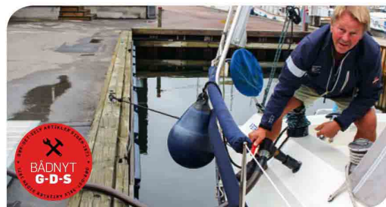
SÅDAN TØMMES HOLDINGTANKEN