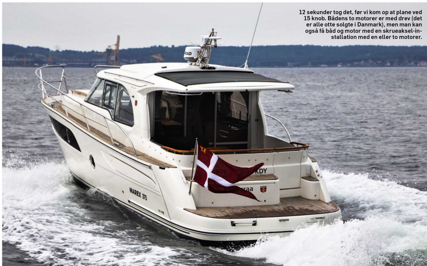
12 sekunder tog det, før vi kom op at plane ved 15 knob. Bådens to motorer er med drev (det er alle otte solgte i Danmark), men man kan også få båd og motor med en skrueraksel-installation med en eller to motorer.

ramme gæsterne om bord, og mindreårige børn er pænt sikret. Også på agterdækket er der en del stuverum under sæderne. Og vil man bade, er der en kæmpe tre meter bred og 0,85 meter dyb badeplatform, hvor der i styrbord side under badeplatformen er placeret et hækanker, der sænkes elektrisk, ligesom også ankeret i stævnen. Under sidedækkene er fortøjninger og fendere gemt væk, en god og praktisk løsning. Båden er i det hele taget gennemført praktisk, hver en centimeter er udnyttet optimalt. Båden er meget vellykket og sælger da også godt. Marex har vist, at de igen kan lave både, der vinder priser, næsten hver gang de kommer frem. Nordmændene forstår samtidig, at sejlere ønsker frisk luft. Det får man med et kalechesystem i verdensklasse, hvor du kan åbne ruftaget eller lukke agterdækket til på få sekunder, så du har endnu mere plads ude.